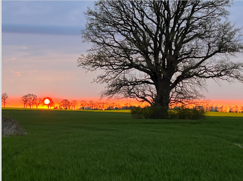
Dat wunnerschöne Kaff mit ein Sünnünnergang