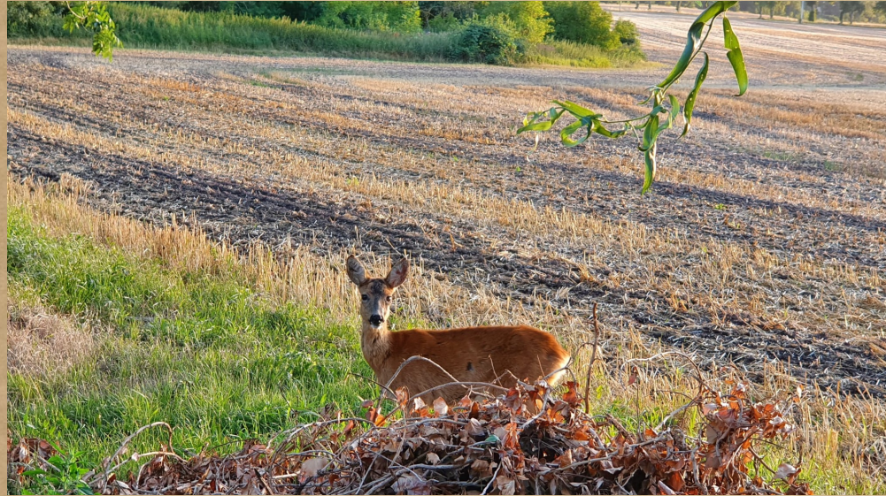
Ein Riek up dat Feld