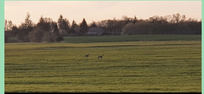
Dor is dat Feld mit de Ricken. 🌾🦌