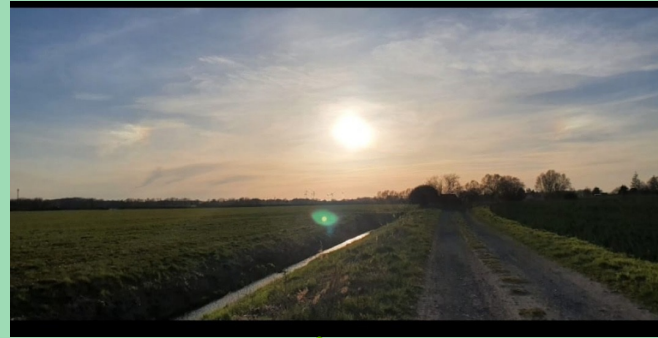
Dor is de Wech un dat Feld. 🍀

Ik gåh ofteis dor spazieren un hür giern Musik 🎵 dor bi. Dor fäuhl ik mi bannig woll, denn ik kann dor all mienen Stress vergäten. 😊